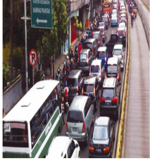
Gambar 2.2 Pengendara motor melanggar jalur Busway. Bagaimana pendapat kalian?