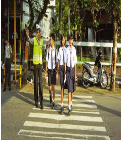
Gambar 2.1 Siswa Menyeberang Jalan Menggunakan Zebra Cross