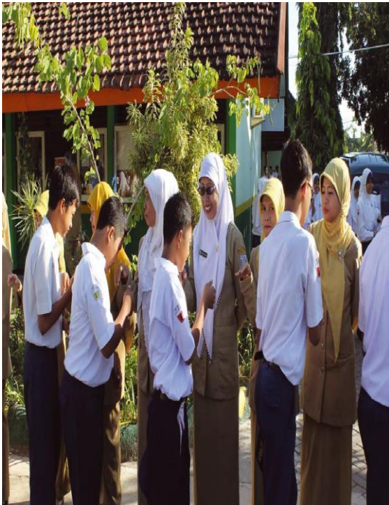
Gambar 2.4 Contoh perilaku sopan peserta didik kepada guru