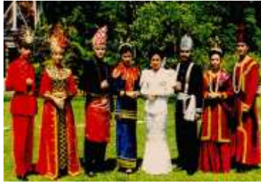
Gb. 4.3 Keberagaman Budaya

Sekolah : SMP Negeri 3 Songgom Mata Pelajaran : PPKn Kelas / Semester : IX / Dua Bab 4 : KEBERAGAMAN MASYARAKAT INDONESIA