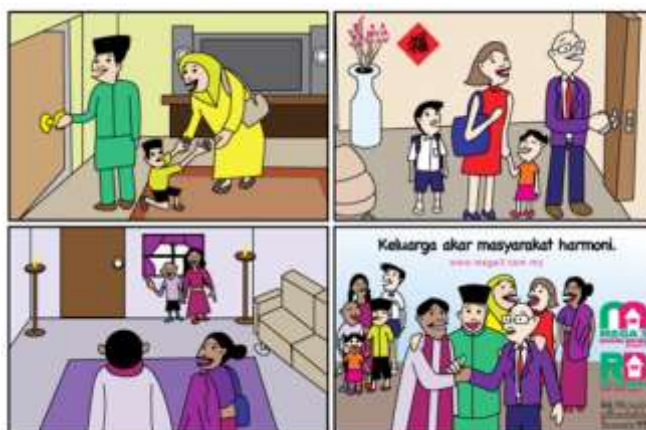
Gambar : 5.1 Harmoni dalam masyarakat bermula dari harmoni di lingkungan keluarga ( Ya, tentu saja keluarga merupakan akar harmoni dalam masyarakat ).

Sekolah : SMP Negeri 3 Songgom Mata Pelajaran : PPKn Kelas / Semester : IX / Dua Bab 5 : HARMONI DALAM KEBERAGAMAN MASYARAKAT INDONESIA