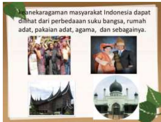
Gb. 4.2 Keanekaragaman masyarakat Indonesia

Sekolah : SMP Negeri 3 Songgom Mata Pelajaran : PPKn Kelas / Semester : IX / Dua Bab 4 : Keberagaman Indonesia dalam rangka Bhineka Tunggal Ika