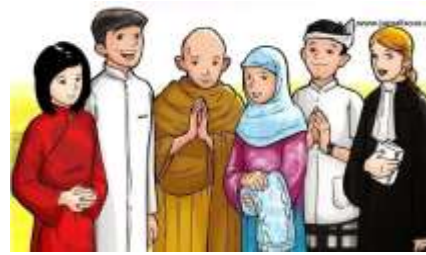
Gb. 4.4 Keanekaragaman Agama

Setelah mengamati Gambar 4.3 , 4.4 diatas dan membaca materi Permasalahan Keberagaman dalam masyarakat Indonesia Jawablah pertanyaan-pertanyaan dibawah ini secara jelas dan tepat ! ( Hal 101-105 )