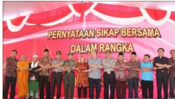
Gb. 4.1 Persatuan dalam keberagaman

Sekolah : SMP Negeri 3 Songgom Mata Pelajaran : PPKn Kelas / Semester : IX / Genap Bab 4 : Keberagaman Masyarakat Indonesia dalam Bingkai Bhinneka Tunggal Ika