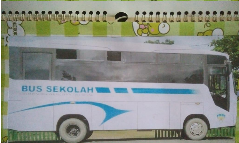
December 22 nd , 2018, boys and girls scout members in my school visited Outbond Ecotourism in Kujau Village on Saturday. We went there at 09.00 a.m. by school bus.