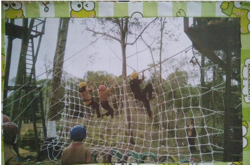
Then, we climbed spider web.