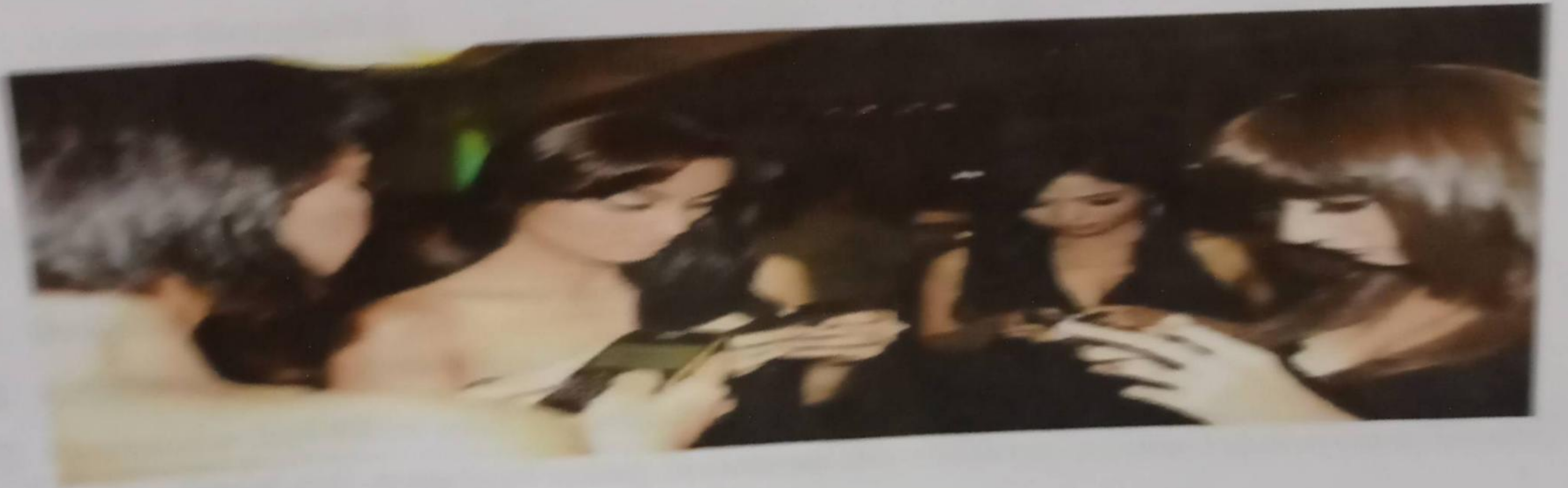
Gambar 1 Gaya hidup kecanduan gadget