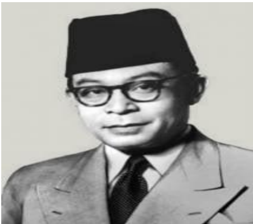
Drs. MOH. HATTA