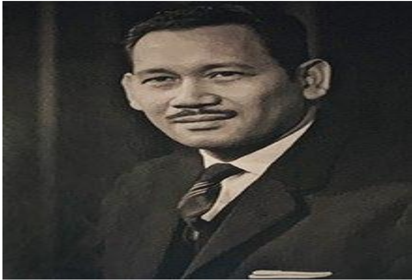
BURHANUDDIN MOHAMMAD DIAH