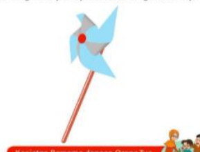
Kegiatan Bersama dengan Orang Tua