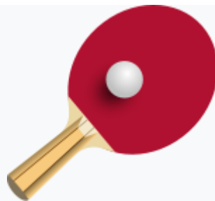
Bat dan bola pingpong

Tahun 1950an, raket yang menggunakan lembaran karet digabung dengan lapisan spons di dasarnya mengubah permainan secara dramatis, meningkatkan kecepatan dan perputaran bola. Ini diperkenalkan perusahaan alat olahraga Inggris S.W. Hancock Ltd. Penggunaan lem cepat dapat meningkatkan kecepatan dan perputaran lebih jauh, yang menghasilkan perubahan peralatan untuk "menurunkan kecepatan permainannya". Tennis meja diperkenalkan sebagai cabang Olimpiade pada tahun 1988.