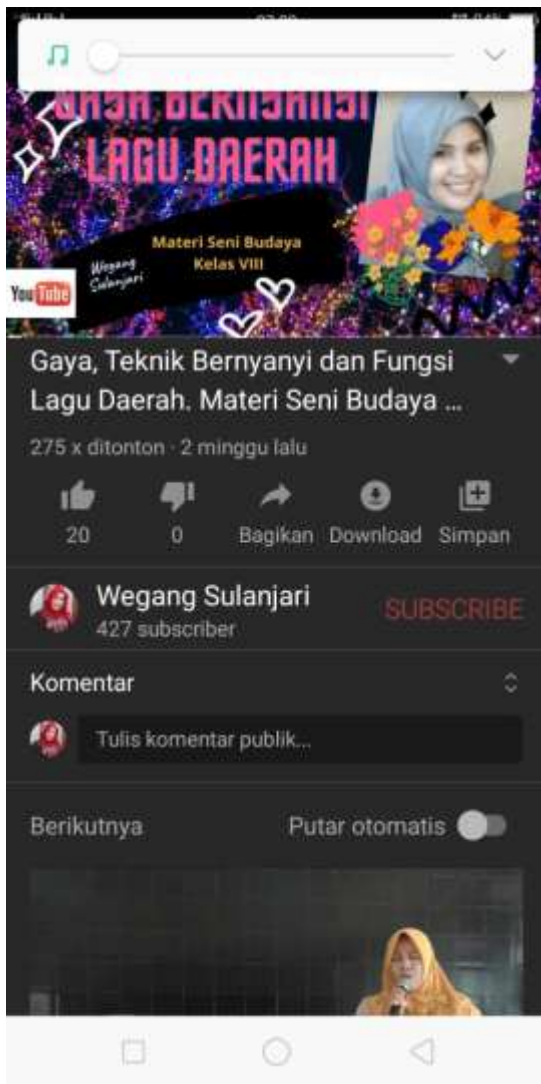
1. VIDEO PEMBELAJARAN DI YOUTUBE