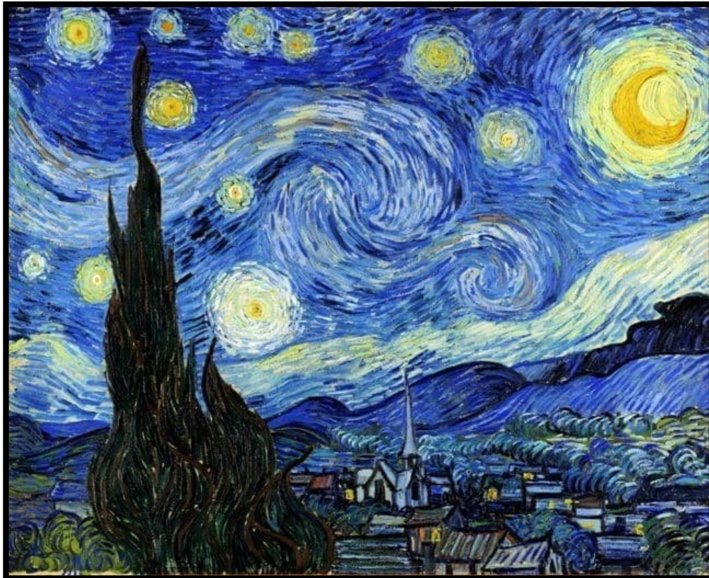
Van gogh, Starry Night , 1889