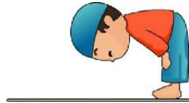
Pustekkom Kemdikbud © 2012