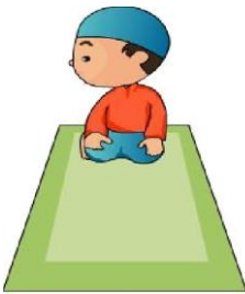
Pustekkom Kemdikbud © 2012