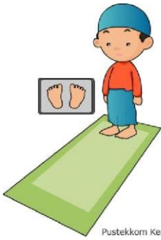
Pustekkom Kemdikbud © 2012