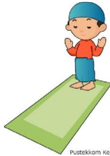
Pustekkom Kemdikbud © 2012