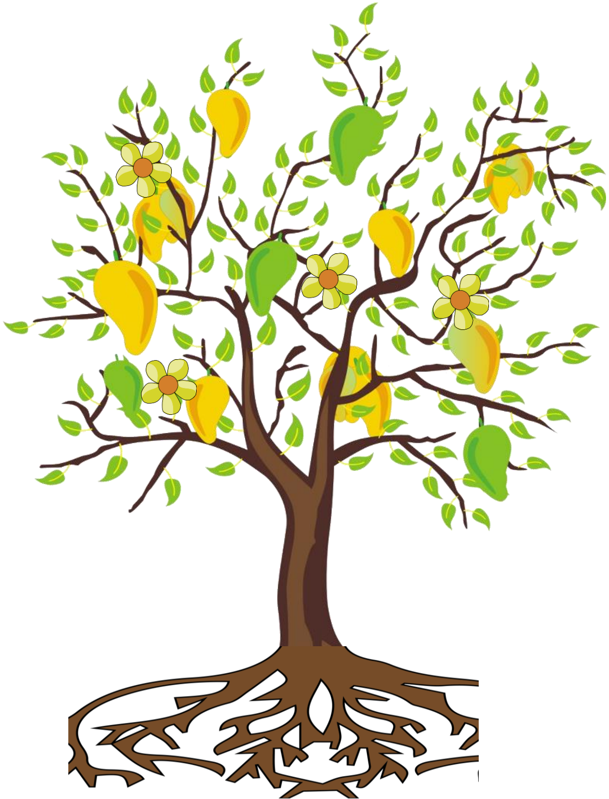
Gambar pohon mangga

Pohon mangga biasanya tumbuh disekitar halaman yang luas supaya tumbuh dengan subur dan lebat. Pohon mangga banyak manfaatnya dari mulai pohonnya kalau udah tua bisa dijadikan bahan dimakan mengandung banyak vitamin dan menyegarkan dan yang menanamnya dapat pahala.