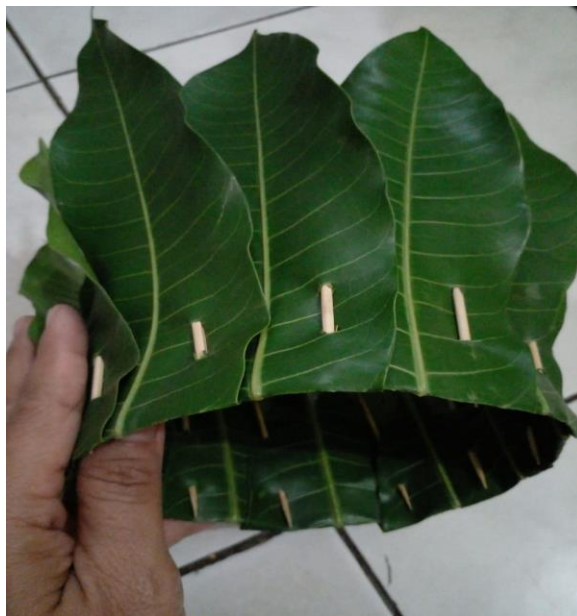
. Daun Pohon Mangga

Supaya anak-anak yang sudah selesai tidak mengganggu anak-anak yang lain maka diadakan kelompok pengaman yaitu dengan bermain plastisin.