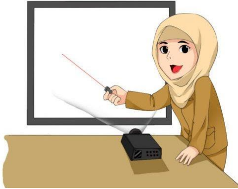
Puisi gambar 1

Berdasarkan gambar dibawah ini buatlah sebuah karya puisi ! Pilih salah satu saja.