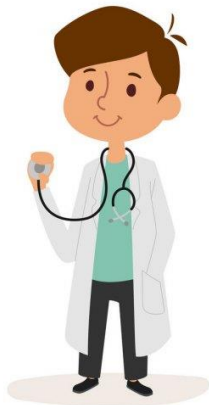
Puisi gambar 2