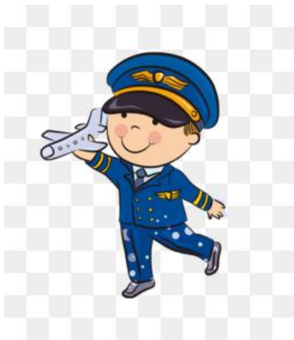
Puisi gambar 3