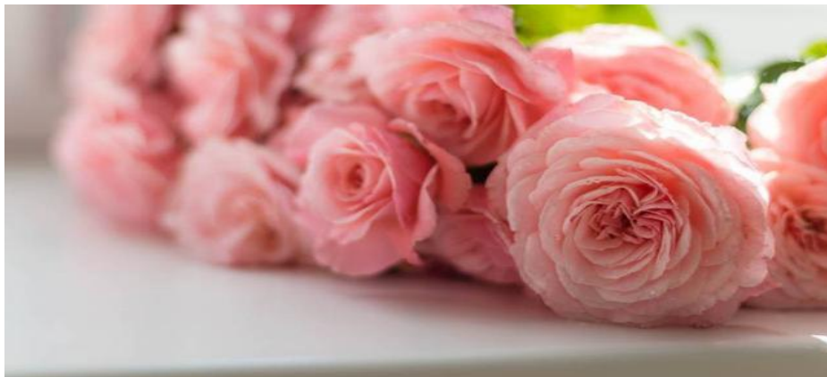
Ilustrasi bunga mawar.

Dikarenakan warna dan bentuknya yang sangat indah, bunga mawar biasanya dijadikan sebagai tanaman hias. Tetapi, di balik keindahannya, bunga mawar mempunyai banyak manfaat, di antaranya sebagai anti bakteri, anti viral, anti depresan, anti peradangan, dan sumber vitamin C. Selain itu banyak produk kecantikan seperti parfum, sabun, pelembab, dan sebagainya yang menggunakan bunga mawar sebagai bahan pembuatannya. Mawar juga bisa dimanfaatkan untuk teh, jelly, dan selai.