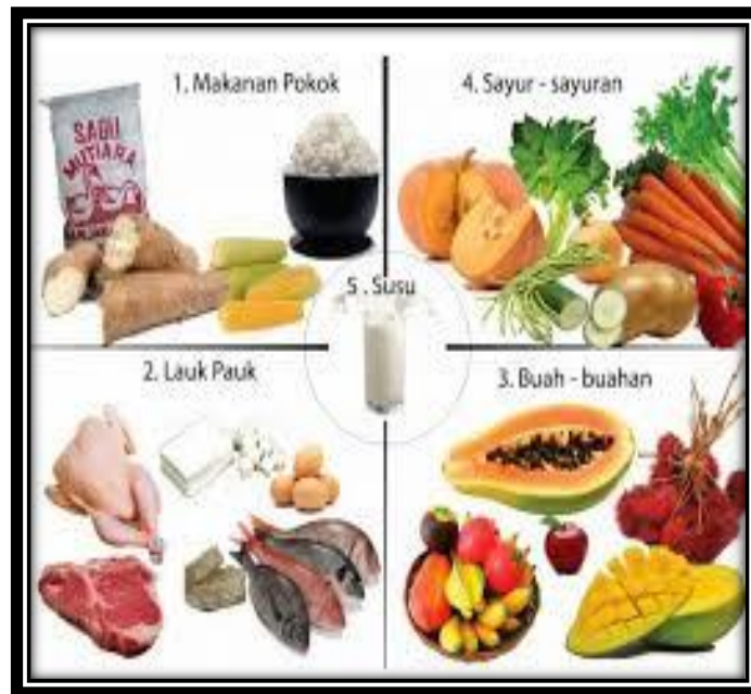
Gambar 4 sehat 5 sempurna