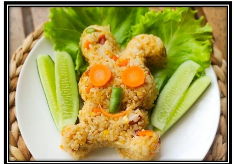
Membentuk / mencetak nasi dan menghiasnya