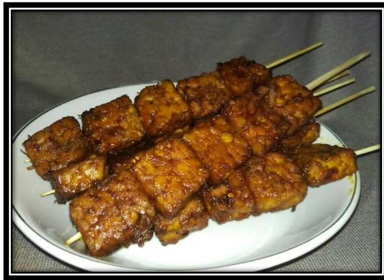
Membuat Sate Tempe 1 - 5