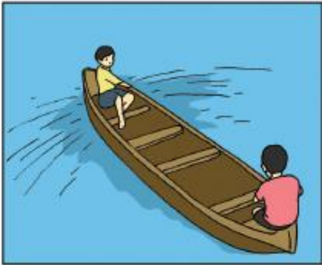
Diambil dari buku Tematik K13 Tema 7