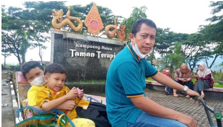
Badan sehat keluarga senang.