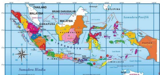
Peta Kondisi Geografis Negara Indonesia