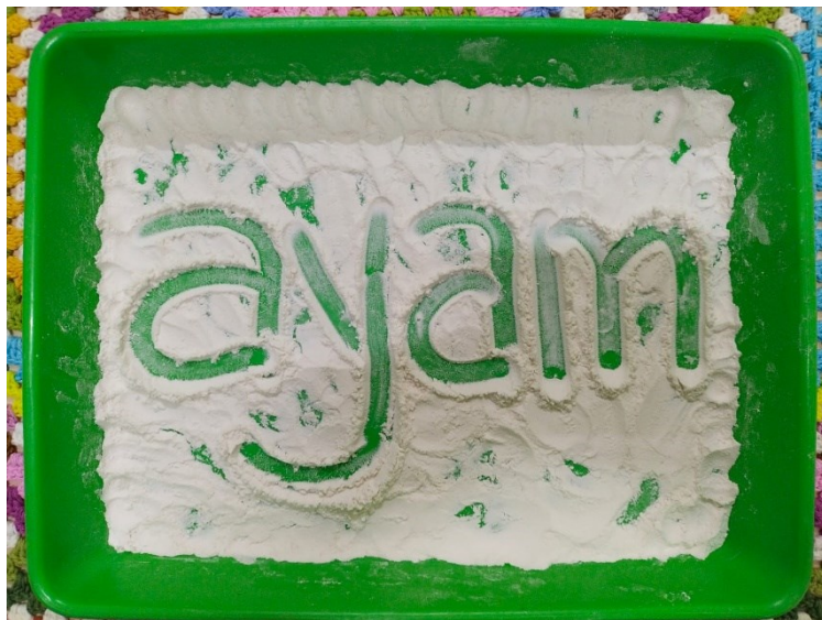
Menulis huruf pada tepung