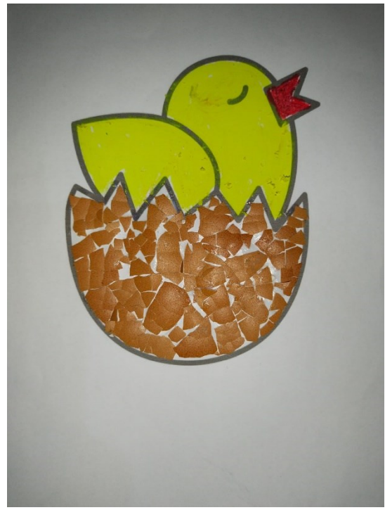
Kolase dengan cangkang telur ayam