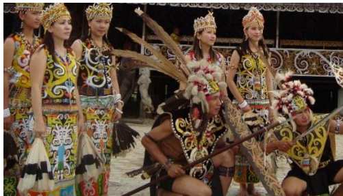
Suku Dayak Dari Kalimantan Barat