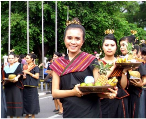
Suku Sasak Dari NTB