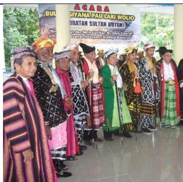
Suku Buton Dari Sulawesi Tenggara