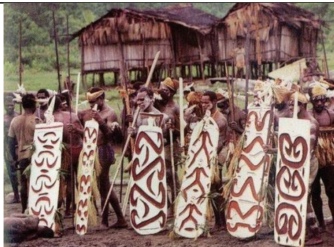
Suku Asmat Dari Papua