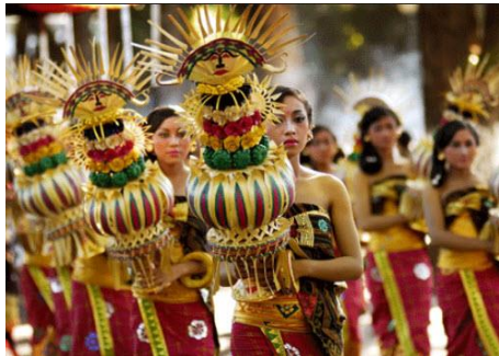
Suku Bali Aga Dari Bali