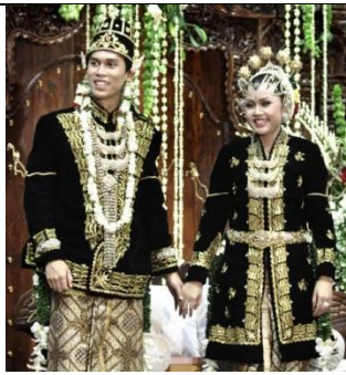
Suku Jawa Dari D.I Yogyakarta