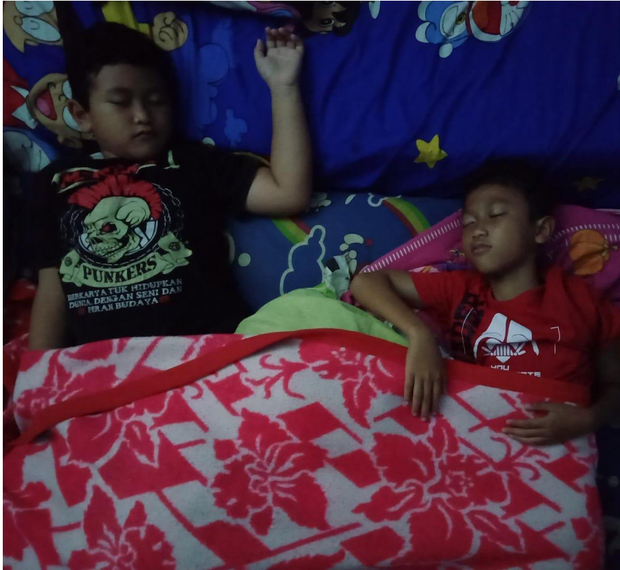
Istirahat yang cukup