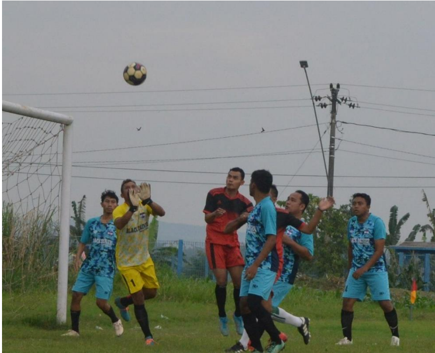
Berolahraga yang teratur