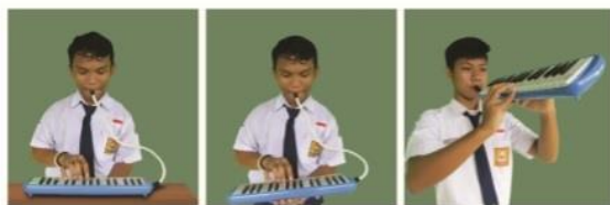
Gambar 2.2 Beberapa cara memegang pianika