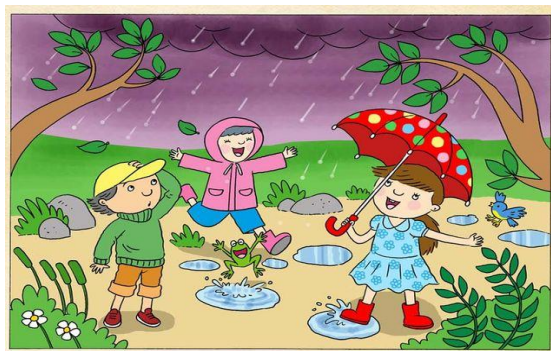
Gambar : Kibrispdr.org