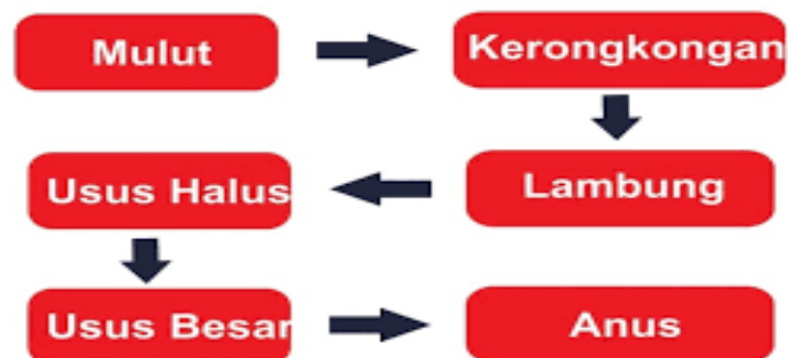
Diagram Sistem Pencernaan Manusia