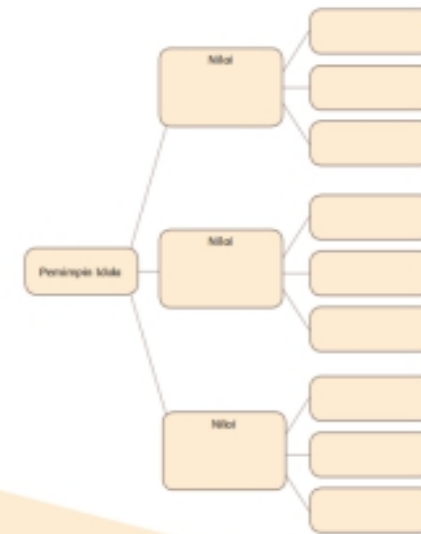
Gambar LKPD 1