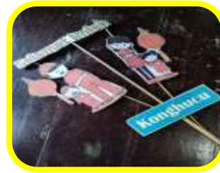
Gambar yang dibentuk seperti wayang