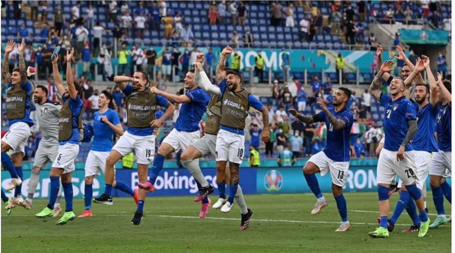
Sepak Bola - Euro 2020 - Grup A - Italia v Wales - Stadio Olimpico, Roma, Italia - 20 Juni 2021 Italia merayakan dengan penggemar setelah pertandingan Pool via REUTERS/Andreas Solaro TPX IMAGES OF THE DAY