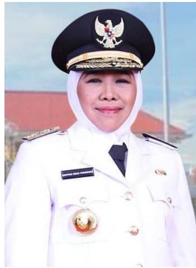
Gubernur Jawa Timur