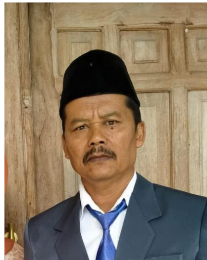
Kepala SDN Tanjungsari