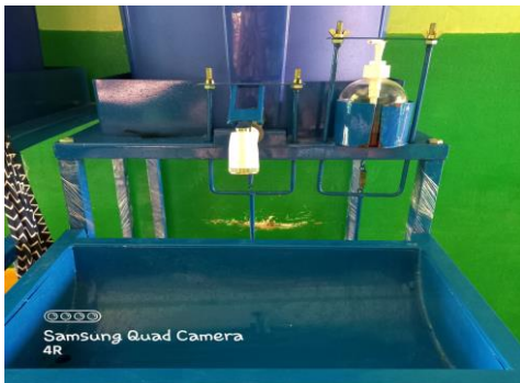
Gambar disamping adalah alat peraga untuk praktik/aksi nyata mengenai aturan penggunaan air bersih di sekolah.

Musim kemarau yang berkepanjangan akan menyebabkan kekering, sehingga di beberapa tempat mengalami kesulitan air bersih sedangkan air sangatlah penting dalam kehidupan sehari-hari kita. Contoh : seperti sawah, mencuci piring, menyiram tanaman dan lain-lain. Untuk itu kita perlu mengetahui bagaimana cara untuk menghemat air bersih dengan baik. Dengan adanya kondisi seperti ini maka perlu adanya aturan-aturan penggunaan air bersih di rumah atau sekolah agar kita bisa menghemat air dan tidak mengalami kekurangan air bersih.