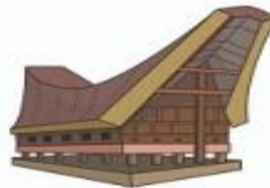
Rumah Adat Tongkonan (Rumah Adat Provinsi Sulawesi Selatan/Sulsel/Suku Toraja)