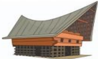
Rumah Balai Batak Toba (Rumah Adat Sumatera Utara/Sumut)