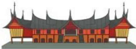
Rumah Gadang (Rumah Adat Sumatera Barat/Sumbar)