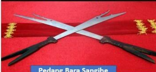
Pedang Bara Sangihe