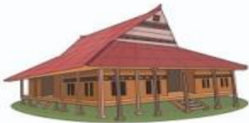
Baileo (Rumah Adat Provinsi Maluku)