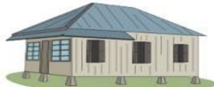
Rumah Adat Bangka Belitung