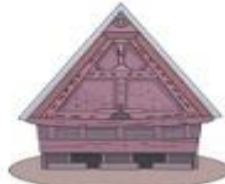
Rumoh Aceh (Rumah Adat Nanggroe Aceh Darussalam)