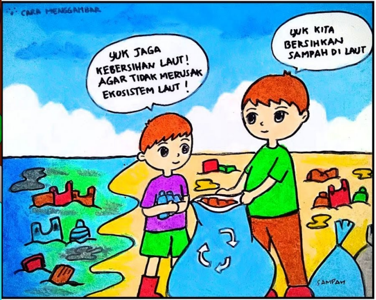
Contoh gambar cerita tentang kesehatan/kebersihan