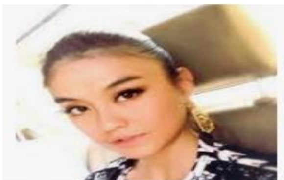
Descriptive Text : Agnes Monica ...