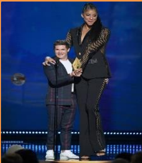
TALL - SHORT