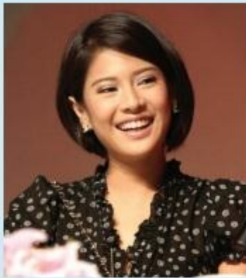
Gambar 1.5 Model rambut bob.

Gaya rambut bob pendek kini mulai disukai lagi. Meski terlihat sederhana, untuk gaya rambut seperti itu juga diperlukan perawatan yang benar. Ada beberapa langkah dan cara yang harus kamu lakukan untuk merawat rambut pendek dengan baik, yaitu sebagai berikut.