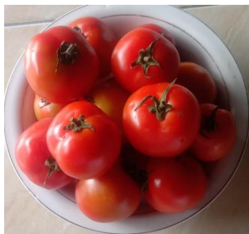
3 gambar buah tomat