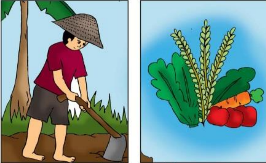
Petani menghasilkan padi dan sayuran

Perhatikan lingkungan yang ada di sekitar tempat tinggalmu. Adakah pekerjaan yang dapat menghasilkan barang? Pekerjaan yang menghasilkan barang merupakan pekerjaan yang hasil pekerjaannya dalam bentuk barang. Contohnya petani, pengrajin dan penjahit. Perhatikan gambar di bawah ini.