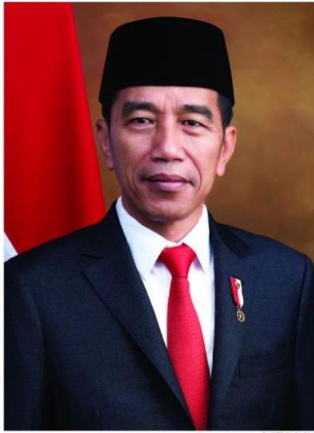
Ir. H. Joko Widodo Presiden Republik Indonesia

Ir. H. Joko Widodo adalah Presiden Indonesia yang mulai menjabat sejak 20 Oktober 2014. Pendidikannya diawali dengan masuk SD Negeri 112 Tirtoyoso yang dikenal sebagai sekolah untuk kalangan menengah ke bawah.