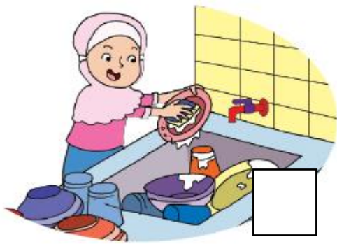
Mematikan keran saat menyabuni piring