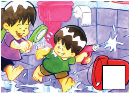
Lina bermain air dengan adiknya.