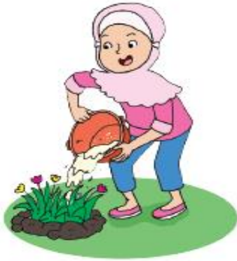
Siti menyiram bunga dengan air bekas cucian beras.

Berilah tanda centang (✓) pada gambar cara menghemat air bersih!