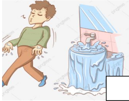
Membiarkan keran air tetap terbuka padahal bak air sudah penuh.