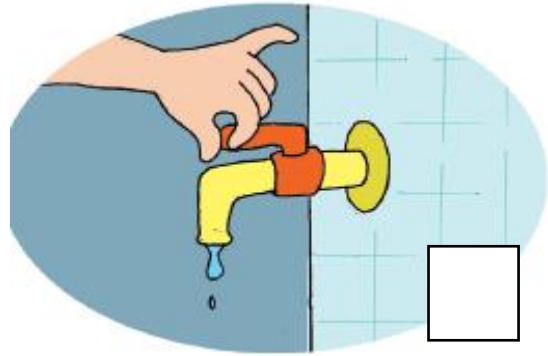
Setelah digunakan, keran air ditutup dengan rapat.