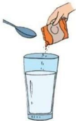
Air + Gula