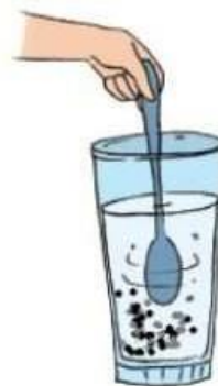
Air + Kopi