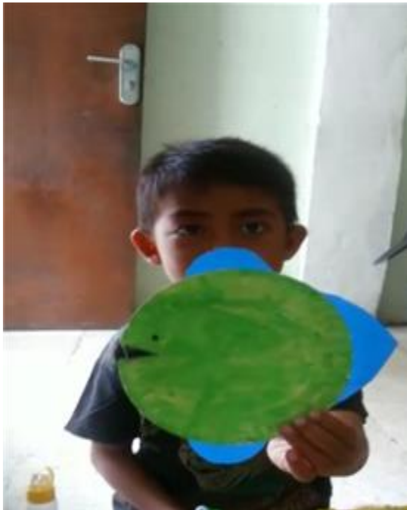
Fatan mampu menciptakan bentuk ikan dari piring kertas