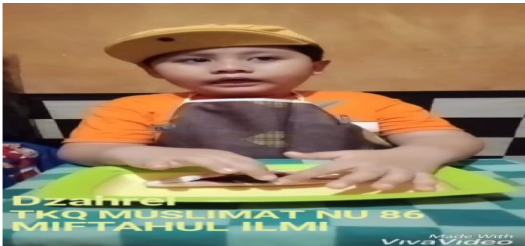
Dzahrel membedah ikan