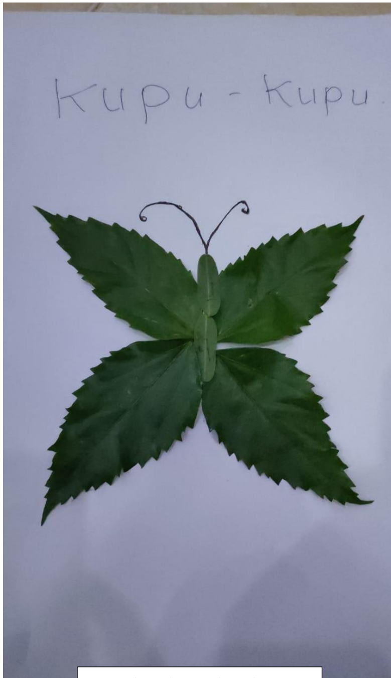
Kolase kupu dari daun