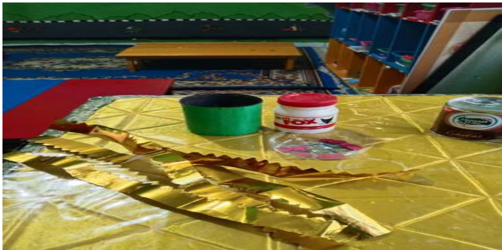
Menghiasi kaleng susu menjadi tempat pensil