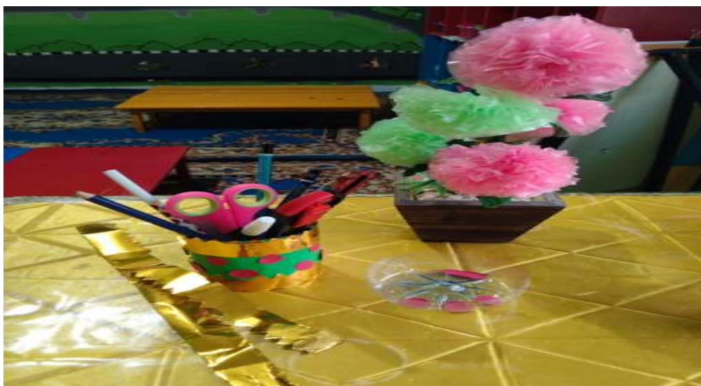
Hasil Karya Anak