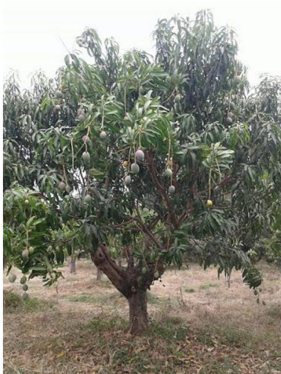
Gambar pohon mangga

Mangga berakar tunggang yang bercabang-cabang, sangat panjang hingga bisa mencapai 6 m. Akar cabang makin ke bawah semakin sedikit, paling banyak akar cabang pada kedalaman lebih kurang 30–60 cm.