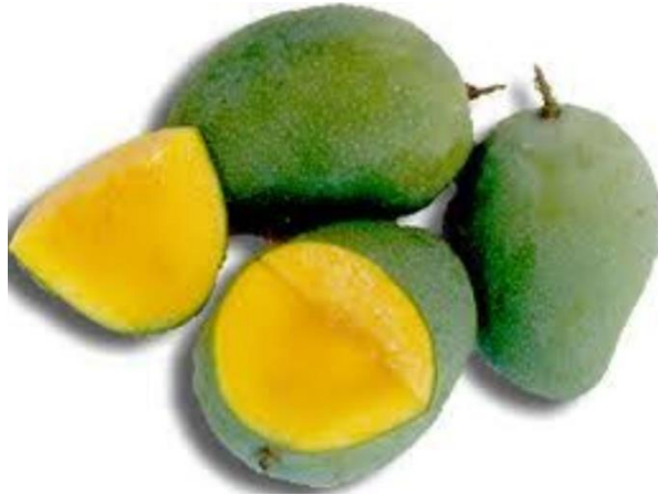
Gambar buah Mangga