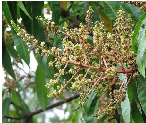
Gambar bunga mangga

Bakal buahnya tidak bertangkai dan terdapat dalam suatu ruangan, serta terletak pada suatu piringan. Tangkai putik mulai dari tepi bakal buah dan ujungnya terdapat kepala putik yang bentuknya sederhana. Dalam suatu bunga kadang-kadang terdapat tiga bakal buah. [4][5][6]