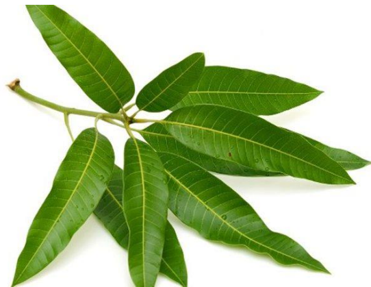
Gambar daun mangga