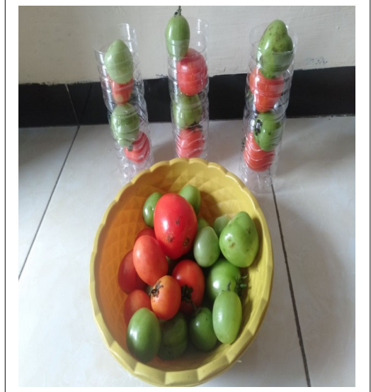
HASIL MENYUSUN POLA AB-AB