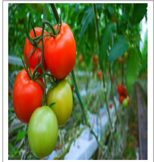
GAMBAR BUAH TOMAT