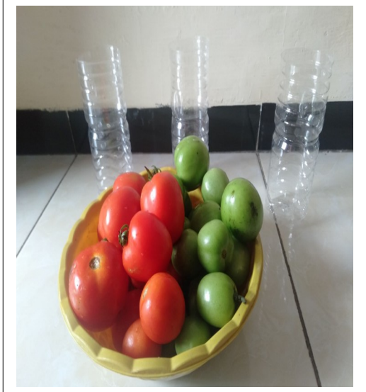
BAHAN MENYUSUN POLA AB-AB