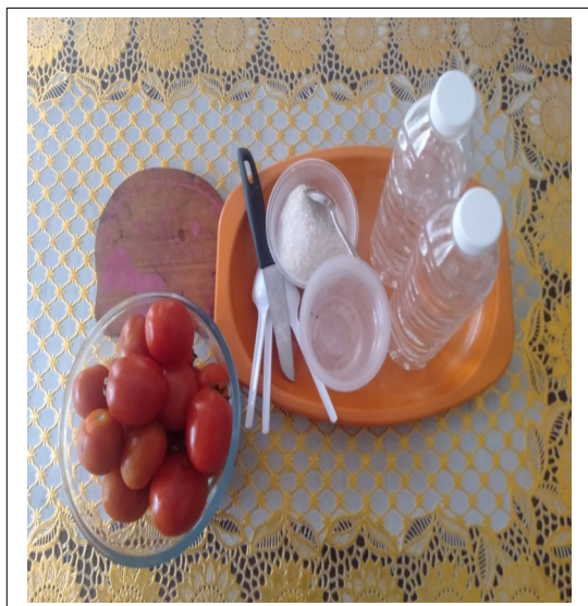
ALAT DAN BAHAN MEMBUAT SERBAT TOMAT