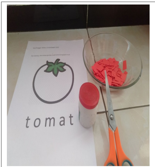
ALAT DAN BAHAN MEMBUAT KOLASE