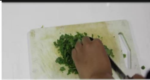
Bayam dipotong menjadi bagian kecil