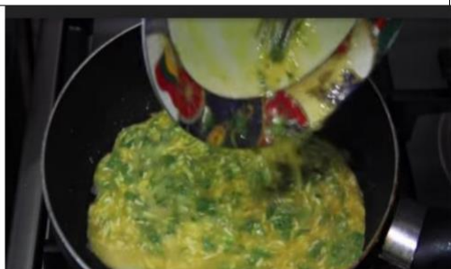
Masukkan campuran adonan ke dalam penggorengan