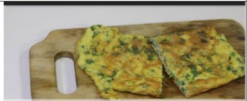
OMELET BAYAM SIAP DISAJIKAN

Ditunggu hasilnya ya sayang, kirim video dan foto ananda melauai WAG