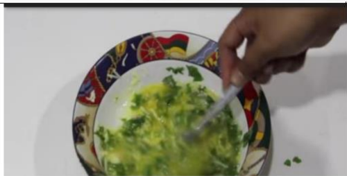
Aduk hingga rata