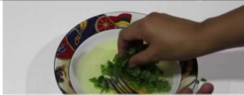
Campurkan bayam, garam, merica & keju