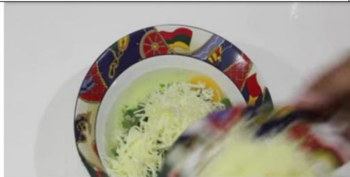
Campurkan bayam, garam, merica & keju