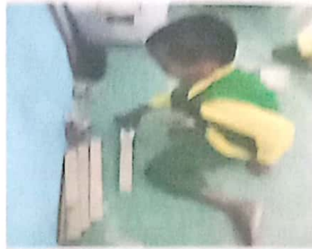
Ayo kita tata balok- balok- ini menjadi sebuah Taman