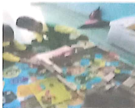
AYO Levi dengan Rasydan, bersemangat untuk membuat taman dengan Yusuf