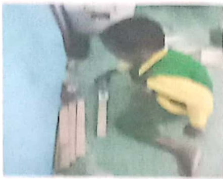
Yusuf mengambal balok- baloknya yang berakuran sedang