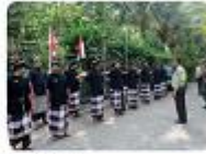
Daerah masyarakat Bali

Banyak bangsa mengalami kehidupan masyarakat Indonesia yang sangat beragam, tetapi dapat tetap bersimpangan dengan damai. Banyaknya pulau menyempatkan juga banyaknya kehidupan sosial dan budaya yang ada. Setiap suku yang hidup di suatu daerah mempunyai kehidupan sosial dan budaya yang khas dan unik. Belum lagi banyaknya bahasa yang digunakan oleh masyarakat tersebut. Akan tetapi ternyata, perbedaan itu justru menjadi kekuatan dan kekayaan bangsa Indonesia. Perbedaan tersebut justru memperkuat masyarakat untuk tetap berada dalam naungan Negara Kesatuan Republik Indonesia.