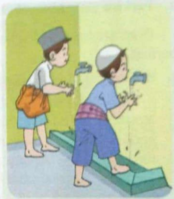
Gambar 4.1 Berwudu dapat menghilangkan hadas kecil.

Hadas kecil adalah keadaan tidak suci yang mewajibkan seseorang untuk berwudu. Apabila seseorang sedang berhadhas kecil dan hendak melakukan ibadah seperti salat, maka wajib untuk menghilangkan hadasnya terlebih dahulu, yaitu dengan berwudu. Wudu adalah membasuh anggota badan tertentu dengan air suci yang menyucikan (air mutlak) dengan tujuan menghilangkan hadas kecil sesuai syarat dan rukunnya. Mengenai cara berwudu, Allah Swt. berfirman dalam Surah al-Ma'idah Ayat 6.