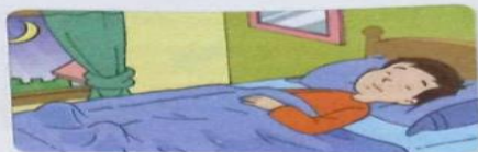
Gambar 4.2 Tidur dapat membatalkan wudu.

Hadas kecil juga bisa disebabkan karena hilang akal. Di antara hal-hal yang disebut hilang akal adalah mabuk, pingsan, ayun, atau tidur (kecuali tertidur dalam posisi duduk). Hal tersebut sesuai hadis Nabi saw. yang artinya, "Dari Ali bin Abu Thalib berkata, Rasulullah saw. bersabda, 'Mata adalah tali penutup dubur, maka barang siapa tertidur hendaklah ia wudu.'" (HR Ibnu Majah)