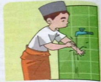
Gambar 4.3 Berwudu harus menggunakan air yang suci dan menyucikan.