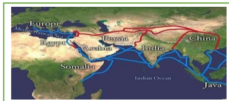
PETA ILUSTRASI MASUKNYA ISLAM KE INDONESIA

https://khazanah.republika.co.id/berita/dunia-islam/islam-digest/ot11se313/dari-jalur-sutra-islam-datang-ke-nusantara