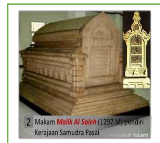
2. Makam Malik Al Saleh (1297 M) pendiri Kerajaan Samudra Pasai