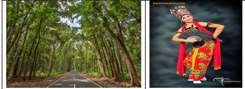
Geo Site Makan Gandrung di Muncar

Taman Nasional Alas Purwo (TN Alas Purwo) terletak di ujung tenggara Pulau Jawa. Di Kecamatan Tegaldimo dan Kecamatan Purwoharjo, Banyuwangi, Jawa Timur. TN Alas Purwo telah lama jadi salah satu pesona wisata unggulan Banyuwangi selain Kawah Ijen. Tempat ini identik sebagai tempat yang angker, mistis, dan penuh misteri. Pasalnya, kawasan ini konon adalah tanah tertua di Pulau Jawa dan memiliki luas mencapai 44.037 hektar.