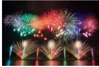
Gambar 2 Kembang Api