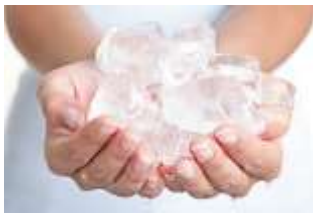
Gambar 1 Es Batu yang meleleh

Reaksi tersebut adalah reaksi pembentukan air dari karbon dioksida. Reaksi tersebut memiliki entalpi positif yang berarti reaksi tersebut menyerap panas dan juga mengalami penurunan suhu. Es batu yang meleleh, penguapan air, proses fotosintesis, bahkan menggoreng makanan dalam wajan juga termasuk reaksi endoterm karena sama-sama menyerap panas dari lingkungan sekitar.