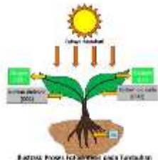
Gambar 2 Fotosintesis