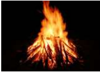
Gambar 1 Api Unggun