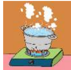
Gambar 3 Merebus air