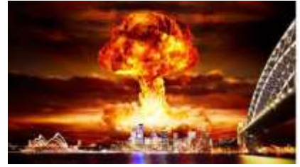
Gambar 1 Bom atom yang meledak